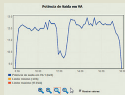
CONSUMO CONSCIENTE DE ENERGIA ELÉTRICA É CULTURA DOS FUNCIONÁRIOS DA CP ELETRÔNICA

Como fica claro, sustentabilidade, na CP, é um conceito eminentemente prático e que diz respeito ao presente, mas sempre com um olhar para o futuro.