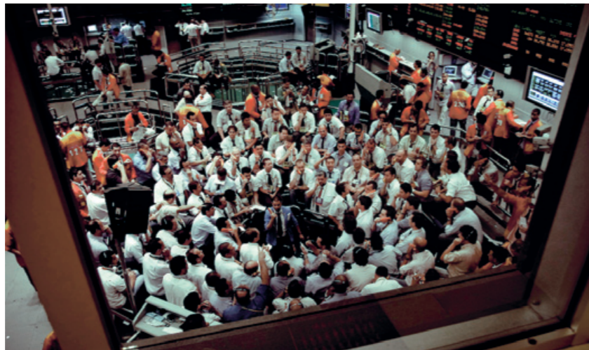
MERCADO FINANCEIRO: ROTINA DA XP, CORRETORA DE VALORES PRESENTE EM CEM CIDADES

A maioria dos equipamentos está instalada no datacenter da matriz, no Rio de Janeiro, que suporta a comunicação com todas as filiais. "Apresentamos soluções com alta tecnologia, utilizando os sistemas ininterruptos de energia da CP Eletrônica através dos equipamentos das famílias Breakless, Classic e Top DSP pa-