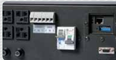
Conexões na traseira do equipamento.