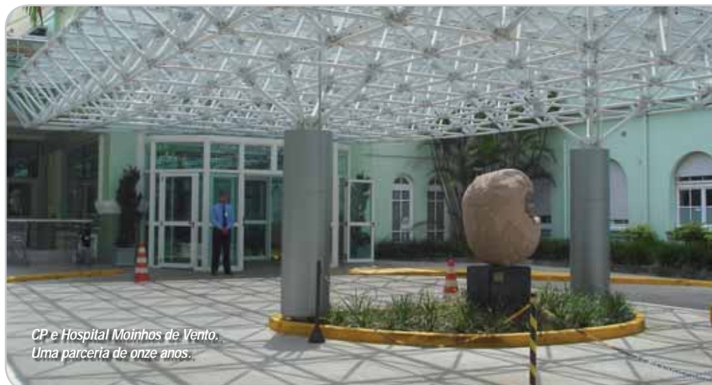
CP e Hospital Moinhos de Vento. Uma parceria de onze anos.

Quando, em 1996, o Hospital Moinhos de Vento (HMV) de Porto Alegre (RS) procurou a CP Eletrônica, tinha uma necessidade: equipamentos que pudessem atender as áreas críticas do hospital. Mas com uma energia de qualidade, que mantivesse em pleno funcionamento todo o sistema de atendimento hospitalar, sem nenhuma interferência ou interrupção.