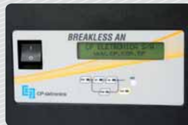
Painel frontal de fácil interpretação.

Segundo Gerson Gabiatti, Gerente de Engenharia, a maior vantagem para o cliente é a considerável otimização de espaço em sua estrutura integrando em um único módulo o sistema de dados (servidores) com sistemas de energia (no breaks e baterias). "Os equipamentos de 3 e 5 kVA ocupam uma altura no bastidor de apenas 2U e 3U respectivamente (sendo U=1,5 pol)", comenta Gerson. Além disso, sistemas em rack solucionam o antigo problema de infra-estrutura elétrica, uma vez que tanto conexões de potência quanto de comunicação podem ser facilmente conectadas na traseira do equipamento.