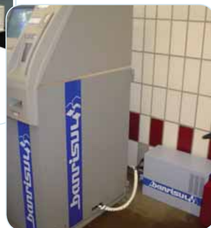
No break personalizado Banrisul