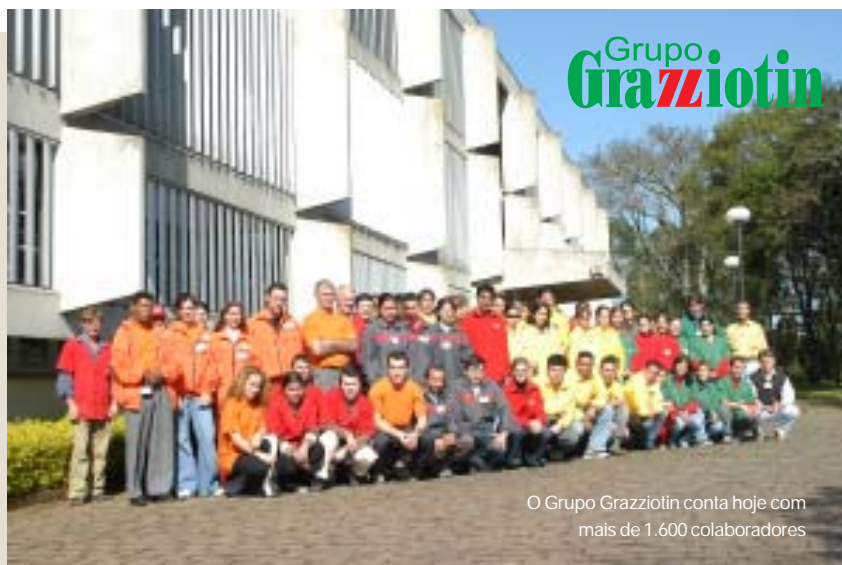
O Grupo Grazziotin conta hoje com mais de 1.600 colaboradores