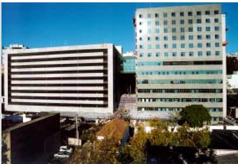
Com mais de 16 mil internações por ano, o HMV conta com equipamentos da CP instalados em locais de atendimento de urgência e emergência no hospital